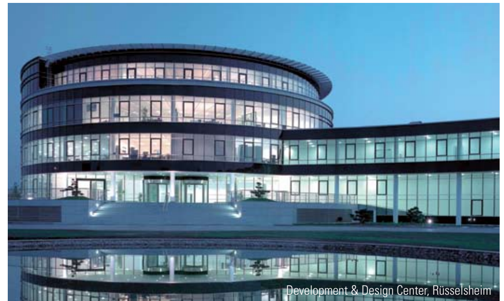
Development & Design Center, Rüsselsheim

De kwaliteit van Hyundai ligt wereldwijd op een zeer hoog niveau. Daarom biedt Hyundai de allerbeste garantie op zijn nieuwe i-modellen: 5 jaar Driedubbele Garantie, zonder beperkingen. Uniek in de autobranche, want vijf jaar garantie op product- en fabricagefouten zonder beperking van het aantal kilometers, zonder uitsluiting van onderdelen en met een uitgebreide mobiliteitsservice in heel Europa, dat is ongekend.